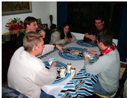
Outros se divertem com o novo carteadado "Mau-Mau" (27-29/07/2007).