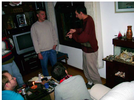
E se falta luz... mímica à luz de velas!!