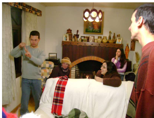
Enquanto finha luz, mímica com luz!