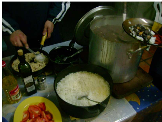
Enquanto uns cozinham a "Feijoada 100%" preparada no retiro de inverno em Canela...